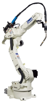
Robô OTC FD-V8