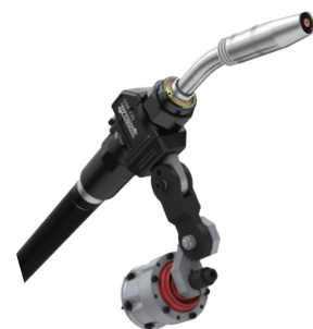
Tocha SU 465