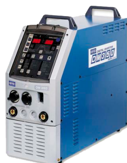
Fonte OTC DM-350