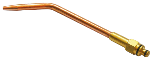
Extensão de solda oxyline 201 acetileno chama simples