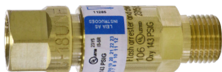
Válvulas secas tipo corta chama para reguladores