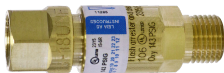
Válvulas secas tipo corta chama para maçaricos