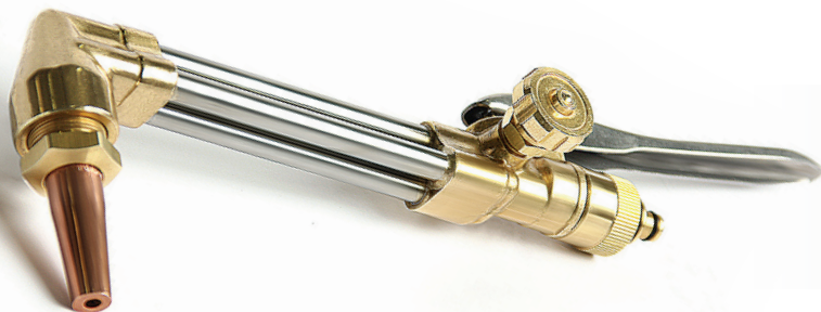
Maçaricos e extensões/cabeça cortadora ca 370-0