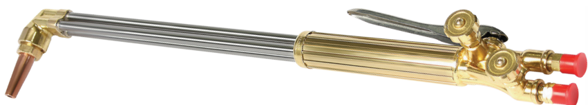
Maçarico de corte manual oxyline st-300