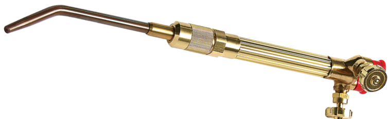
Maçarico wh-370-0 oxyline

Ideal para cortes em ciclo médio/pesado em montagens de estruturas metálicas