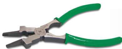
Alicate para limpeza de tochas mig