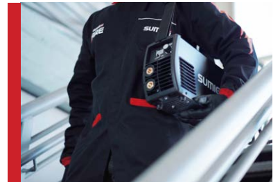
Flexible para varios tipos de trabajos