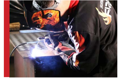
Excelente estabilidad del arco