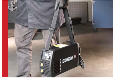
Equipos Compactos y versátil