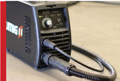
Cables y acoplamientos precisos