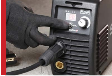
Panel de operación fácil

Black MMA 200 tiene varias características que proporcionan una excelente soldabilidad.