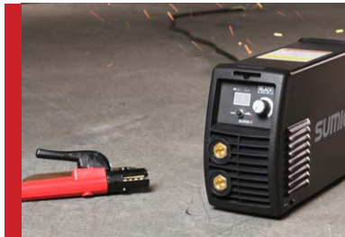
Bajo Consumo de Energía